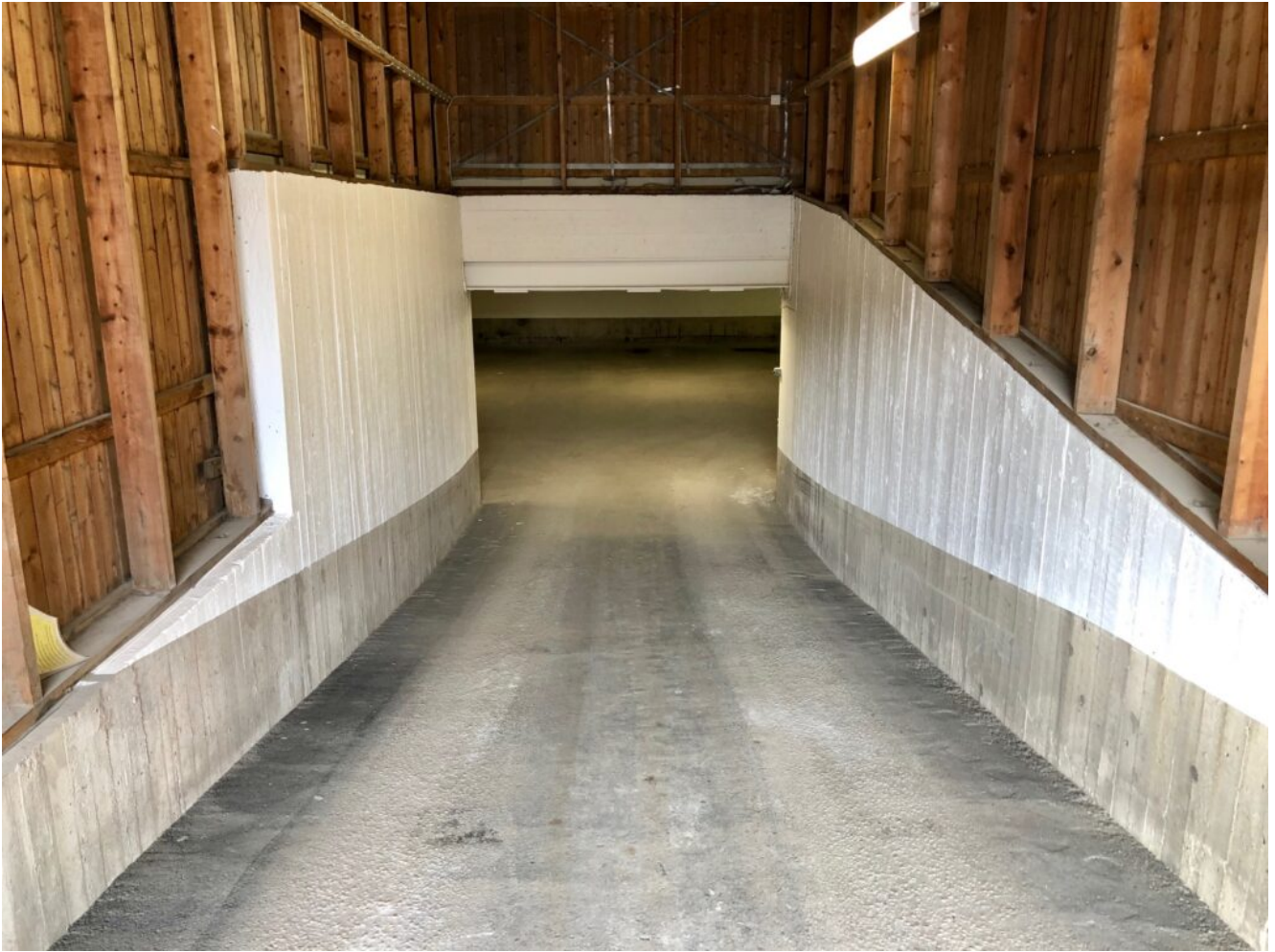
Infart till det nedre garaget.