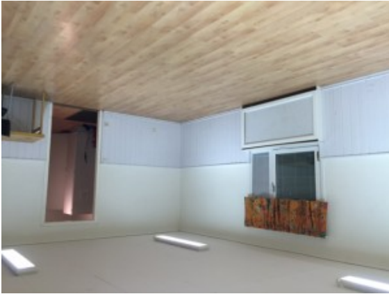
Föreningslokalen innan renovering