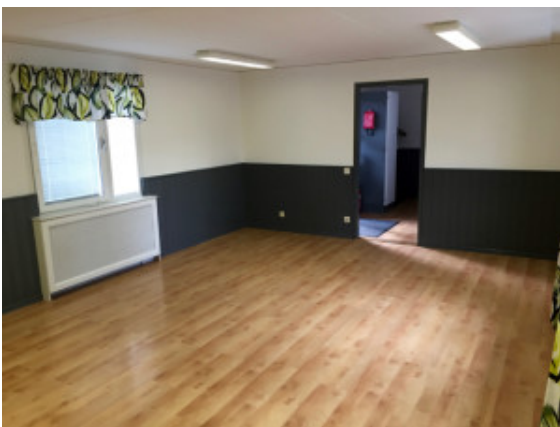
Föreningslokalen efter renoveringen