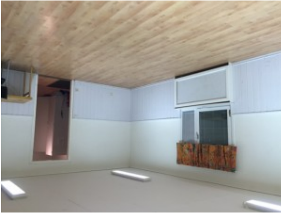
Föreningslokalen innan renovering