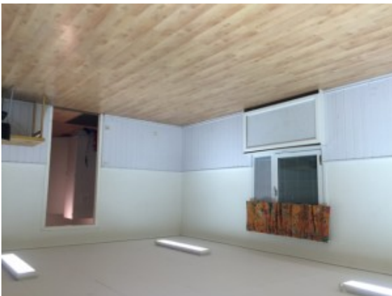
Föreningslokalen innan renovering

Föreningslokalen är nu bokningsbar igen och bokningar görs på den här sidan.