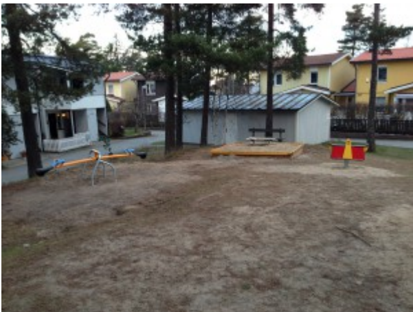
En ny vippgunga, sandlåda med bakkbord och en pendelgunglek på gård 6.