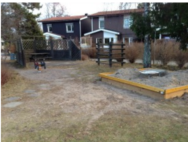
En ny fjädergunglek och en sandlåda med bakkbord vid gård 4.