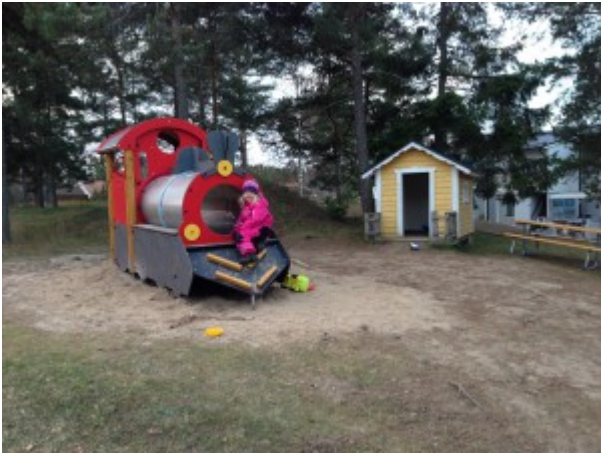
Tåget vid lekplatsen på gård 6.