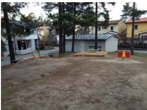
En ny vippgunga, sandlåda med bakkbord och en pendelgunglek på gård 6.