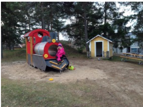
Tåget vid lekplatsen på gård 6.

Även den gamla gungställningen på den stora lekplatsen har bytts ut.